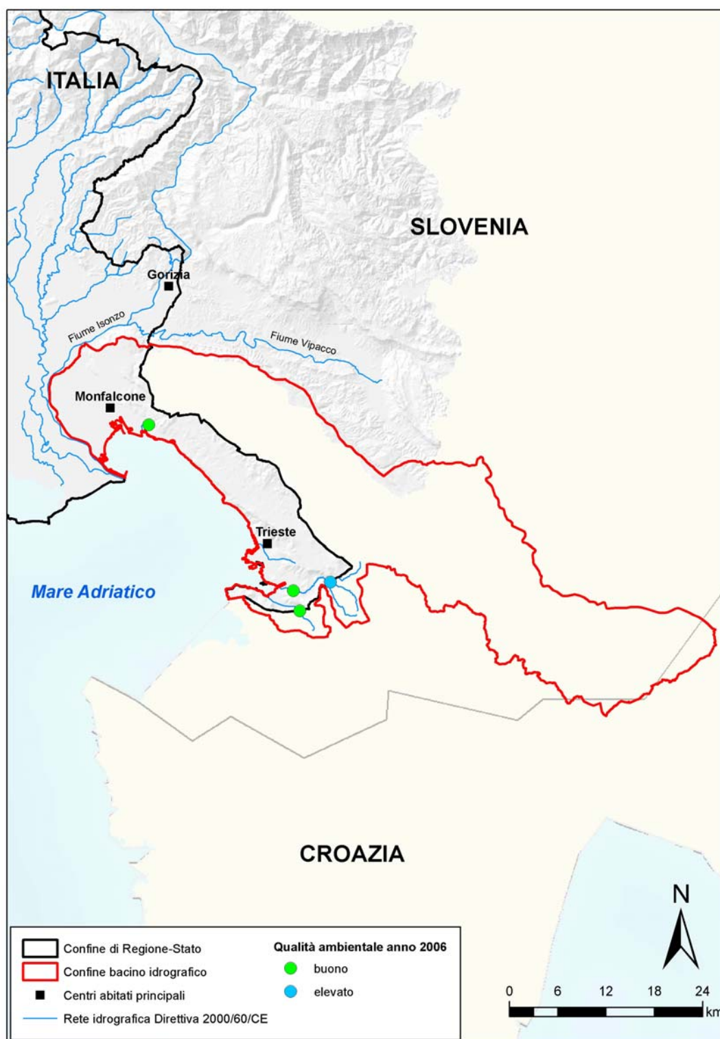
Figura 4.2: risultati della classificazione della qualità ambientale 2006 dei corsi d'acqua del bacino del Levante ai sensi del D.lgs 152/99