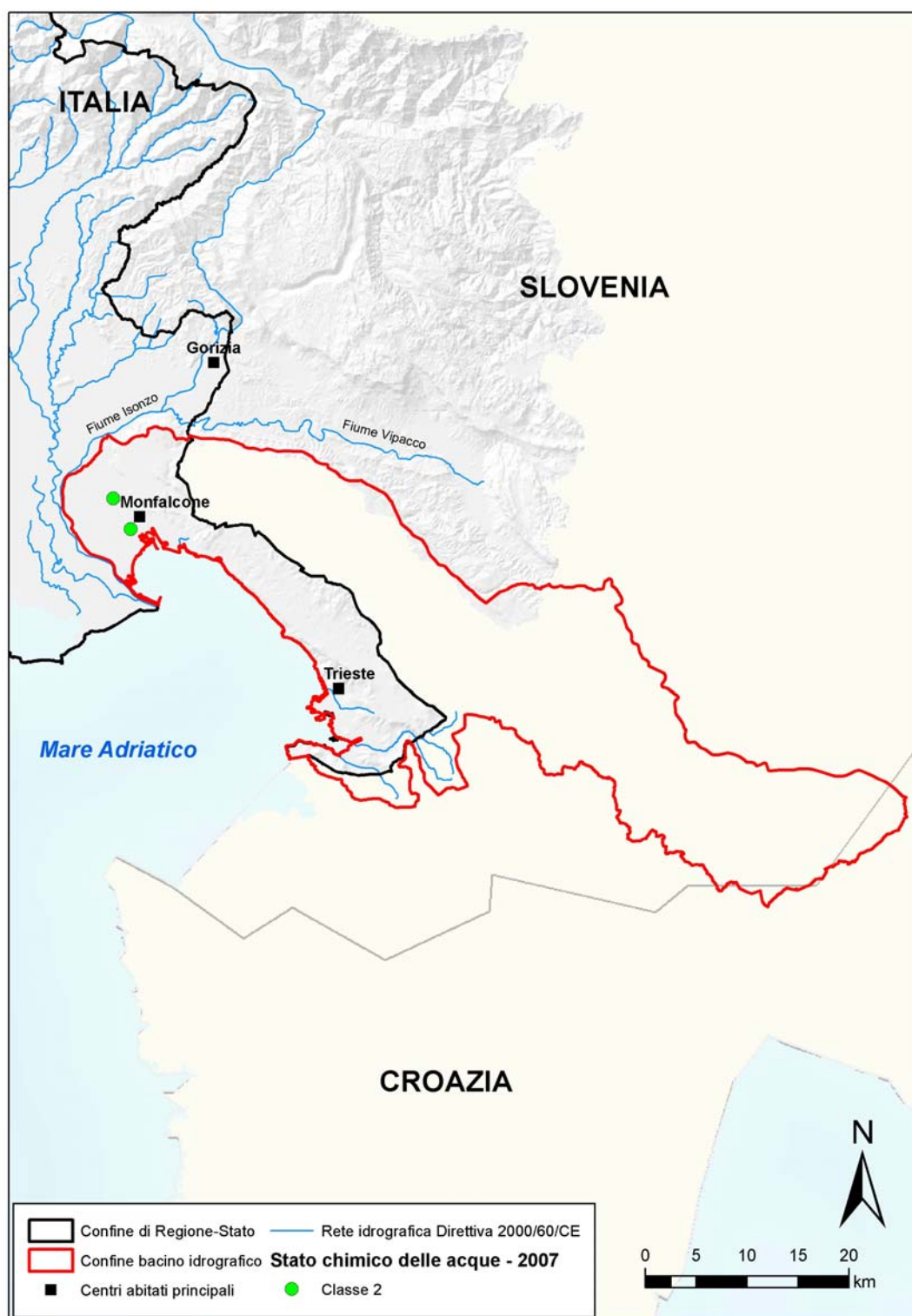
Figura 4.7: mappa dei pozzi di monitoraggio con lo stato chimico delle acque sotterranee