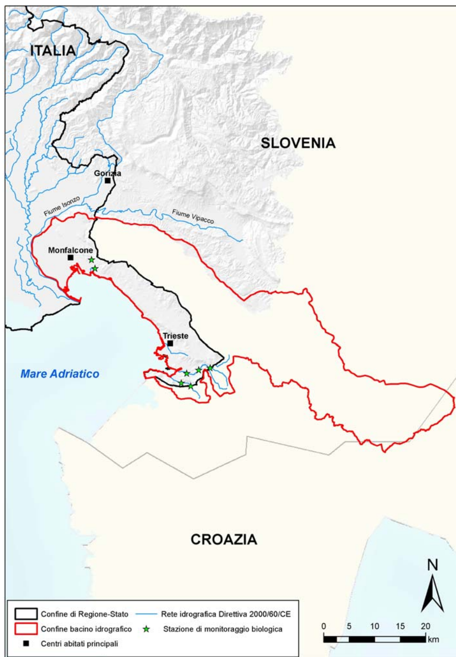
Figura 4.3: mappa dei punti di monitoraggio dei corsi d'acqua del bacino del Levante per il 2009

Nella seguente Figura 4.3 viene riportata la rete di monitoraggio sui corsi d'acqua per l'anno 2009.